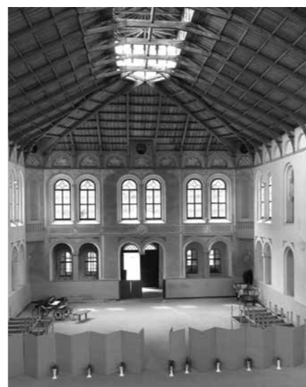
NEJVĚTŠÍ JÍZDÁRNU U NÁS ZACHRÁNILI PŘED DEMOLICÍ VE SVĚTCÍCH U TACHOVA.