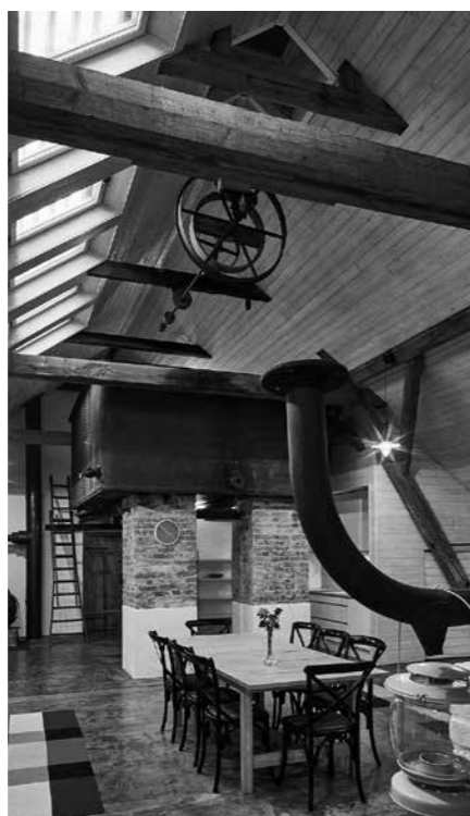
V INTERIÉRECH SE ZACHOVALA ČÁST PŮVODNÍHO TECHNICKÉHO VYBAVENÍ.

Rádi se každoročně připojujeme k masopustu, pořádáme vepřové hody, občasně koncerty a přednášky. Z provedených akcí, které u nás letos proběhly, bych připomněl například oslavy dne sv. Patrika, které jsme uspořádali