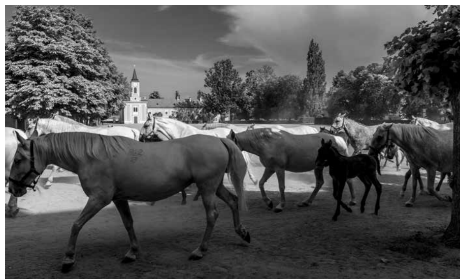
HŘEBČÍN V KLADRUBECH NAD LABEM CHOVÁ KOČÁROVÉ KONĚ OD 14. STOLETÍ. OD ČERVENCE 2019 JE SPOLEČNĚ S KRAJINOU NA SEZNAMU UNESCO.