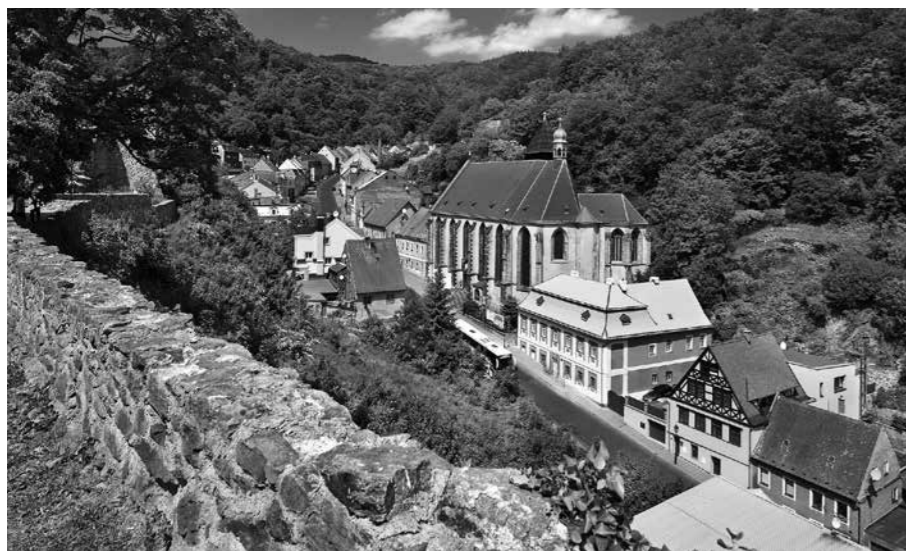
KRUPKA PATŘÍ K NEJSTARŠÍM CÍNOVÝM HORNICKÝM OBLASTEM V KRUŠNÝCH HORÁCH.