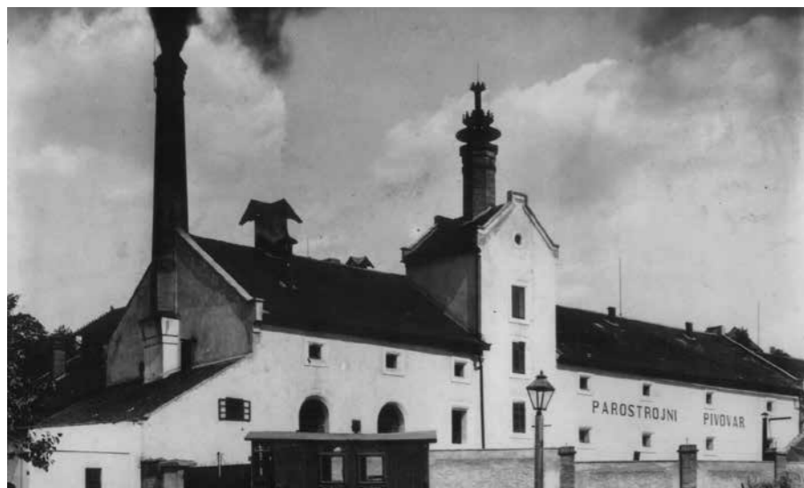
LOBEČSKÝ PIVOVAR VE 20. LETECH MINULÉHO STOLETÍ