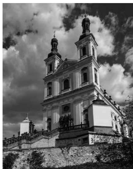
POUTNÍ AREÁL NA CHLUMKU U LUŽE JE OD ROKU 2018 NÁRODNÍ KULTURNÍ PAMÁTKOU.