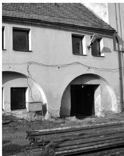
PŮVODNÍ STAV BÝVALÉHO KLÁŠTERNÍHO PIVOVARU