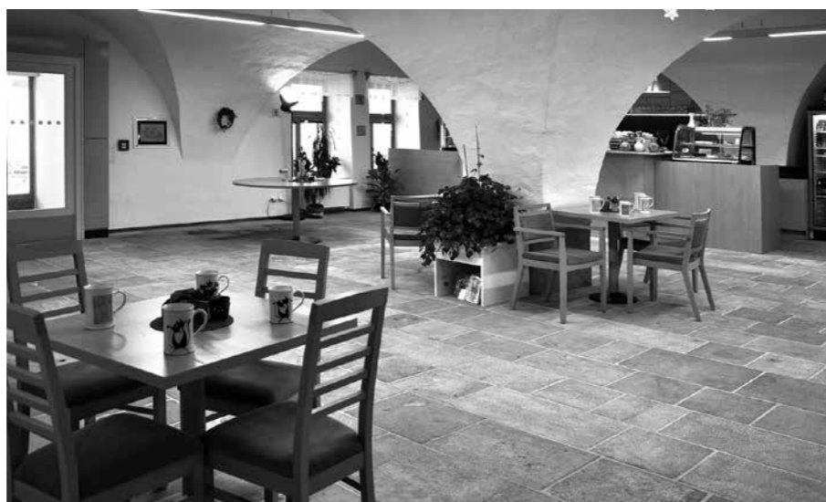
INTERIÉR CAFÉ DAMIÁN. KAVÁRNA BYLA VYBUDOVÁNA V PŘÍZEMÍ BÝVALÉHO PIVOVARU. PO ÚPRAVÁCH JE BEZBARIÉROVÁ, STEJNĚ JAKO CELÝ AREÁL DOMOVA.