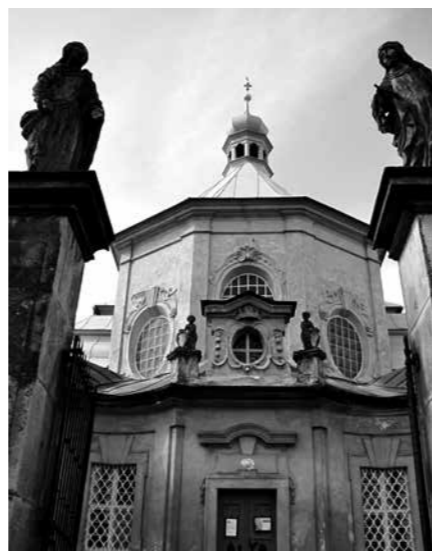
S NÁROČNOU REVITALIZACÍ AREÁLU KOSTELA V HORNÍ POLICI POMÁHÁ TAKÉ KRAJ.

a cestovního ruchu, byly podpořeny všechny žádosti, které splňovaly pravidla fondu.