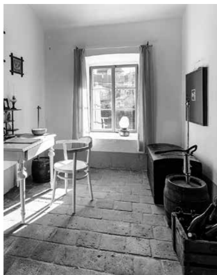
INTERIÉR KANCELÁŘE SLÁDKA

stání, toalet a podobně. Například na sobotní termíny či dny jarních státních svátků, kdy víme, že bude návštěvnost vysoká, neplánujeme žádné kulturní akce a prostřednictvím sociálních sítí návštěvníky nezmene. Také svatební a jiné oslavy se u nás ve špičkách nekonají. Jinak je samozřejmě taková kulturní památka, obnovený historický pivovar na Kokořínsku, velkou atraktivitou v cestovním ruchu nejen pro pivaře, ale především pro návštěvníky – turisty a cyklisty. Negativní roli z hlediska ekonomické udržitelnosti provozu a pracovních míst hraje u nás výrazná sezonnost. Kokořínsko není zimní destinací, a tak je nezbytné dokázat oslovit i firemní klienty.