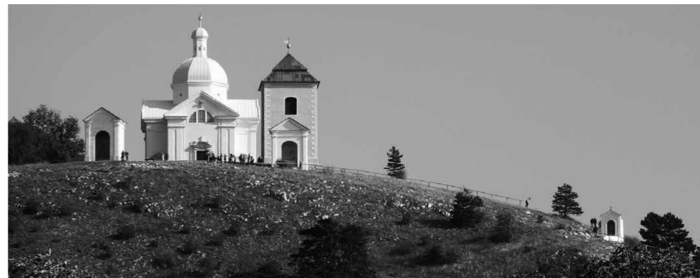
KAPLIČKY KŘÍŽOVÉ CESTY NA SVATÉM KOPEČKU V MIKULOVĚ BYLY PŘED LETY VE ŠPATNÉM TECHNICKÉM STAVU. MĚSTO JE ZÁJEMCŮM NABÍDLA K ADOPCI.

Aktuálně se v pivovaru „zabývá“ provoz restaurace, ubytování i pivovarská provozovna. Celkově je udržitelnost návštěvnického provozu velmi náročná, ať už personálně, tak svojí pracností a všednodenní rutinou služby zákazníkům. Krom profesionalizace provozu bych se rád zmínil také o záměru rozšíření a doplnění expozice o další prvky. Dlouhodobým projektem je i připravovaná monografie. ■