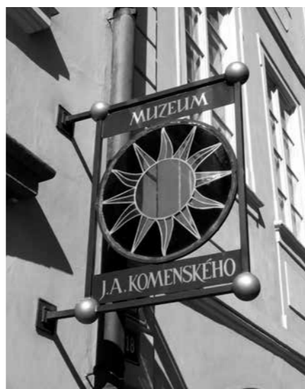
KAŽDÝ NÁVRH REKLAMNÍHO ZAŘÍZENÍ JE POSUZOVÁN INDIVIDUÁLNĚ.