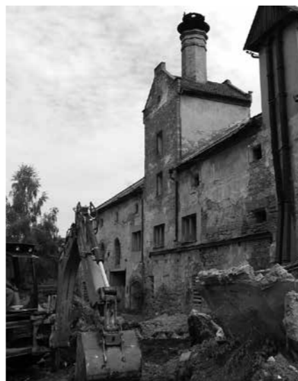
V ROCE 2007 ZAPOČALA ZÁCHRANA ZDEVASTOVANÉHO AREÁLU

Před pár týdny jsem dopočítával aktuální čísla finančních prostředků, které jsme v posledních 12 letech využili k obnově a oživení památky. Celkem bylo nutné využít 32 milionů korun, z toho 58 % finančních prostředků byly vlastní zdroje, složené však také z úvěrů (20 %), které budeme splácet ještě víc než 10 let. V posledních dvou letech začíná být provoz památky ziskový a bilance se konečně obrací k lepšímu. Rozsáhlý projekt obnovy kulturní památky by však nebylo možné realizovat bez přispění z veřejných zdrojů. Celkem jsme v desítkách dílčích projektů na obnovu získali 42 %. Z toho 22 % z evropských projektů (SZIF, MAS Vyhlídky), 14 % z Ministerstva kultury (Program péče o vesnické památkové rezervace a zóny a krajinné památkové zóny), dále 4,5 % ze Středočeského kraje (Středočeský fond kultury a obnovy památek) a zhruba ještě 1,5 % z Ministerstva životního prostředí (Nová zelená úsporám). Odborníka, který se vyzná v cenách ve stavebnictví, možná překvapí, že uvedené celkové náklady jsou s přihlédnutím na počáteční kritický technický stav areálu a značný rozsah projektu, zahrnující krom části expozice také provozovnu pivovaru, ubytová-