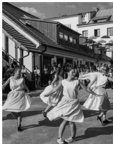
TANEČNÍ A HUDEBNÍ VYSTOUPENÍ PŘÍLÁKALA DVA TISÍCE NÁVŠTĚVNÍKŮ.

Pokud se vydáte do Žďáru nad Sázavou prohlédnout si náměstí, nebudete hledat Rezidenci Veliš příliš dlouho. Náměstí v mírně svažitém terénu lemuje rušná silnice a historickou fasádou se zde pyšní jen málokterá z budov. Obnova domu čp. 64 není pouhou stavební fází, jde především o oživení