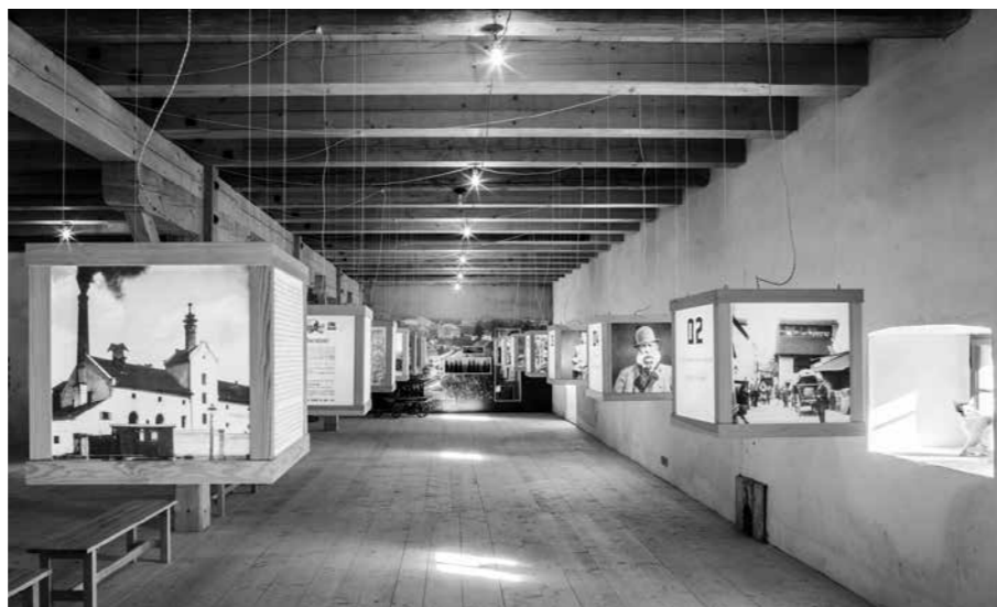
PRO NÁVŠTĚVNÍKY JE PŘIPRAVENA STÁLÁ EXPOZICE O HISTORII PIVOVARU.

Váš spolek stojí i za vznikem muzea v objektu. Přiblížíte jeho expozici? Rozsáhlá část interiéru obnovené památky je dnes věnována prohlídkovému okruhu. Prohlídka s průvodcem začíná u studny před pivovarem, pokračuje v renesančním jádru pivovaru – na humně a v síni někdejšího ležatého hvozdu a pokračuje ve staré varně. Dále vystoupáme do patra, kde je možné si prohlédnout interiér kanceláře sládky a na někdejší sladové půdě čeká návštěvníky stálá výstava o historii pivovaru a zlatých letech českého piva přelomu 19. a 20. století. Po návratu do přízemí průjezdem vstoupíme do pivovarského dvora a podíváme se do trojpodlažní budovy sklepů s kamennou halou lednice z 19. století. Prohlídka končí návštěvou nové řemeslné pivovarské provozovny s novou varnou,