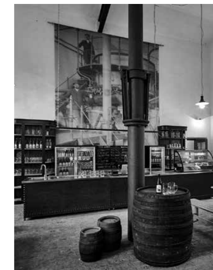
PŘÍKLADNÁ OBNOVA ZÍSKALA OCENĚNÍ NÁRODNÍHO PAMÁTKOVÉHO ÚSTAVU.

že jsme jako architekti k technologii vaření piva měli docela daleko a já sám žádným velkým pivařem nejsem. Rád spíš jen ochutnávám. Teprve v průběhu se ukázalo, že vaření piva bude pro obnovu pivovarskou památku tím nezbytným motivem. Každý, kdo rozestavěný pivovar navštívil, se logicky ptal, kdy že začneme vařit? Situaci dokládá fakt, že výroba piva se nám podařila rozjet až s partnerem projektu po osmi letech od zahájení prací na obnově areálu, na jaře roku 2015. V loňském roce jsme v Lobči uvařili 1 000 hektolitrů piva. Pivo z Lobče má dnes díky sládkovi výbornou pověst a získali jsme i řadu ocenění. Ale někdy mě až mrzí, když si řada našich návštěvníků myslí, že náš pivovar je hospoda.