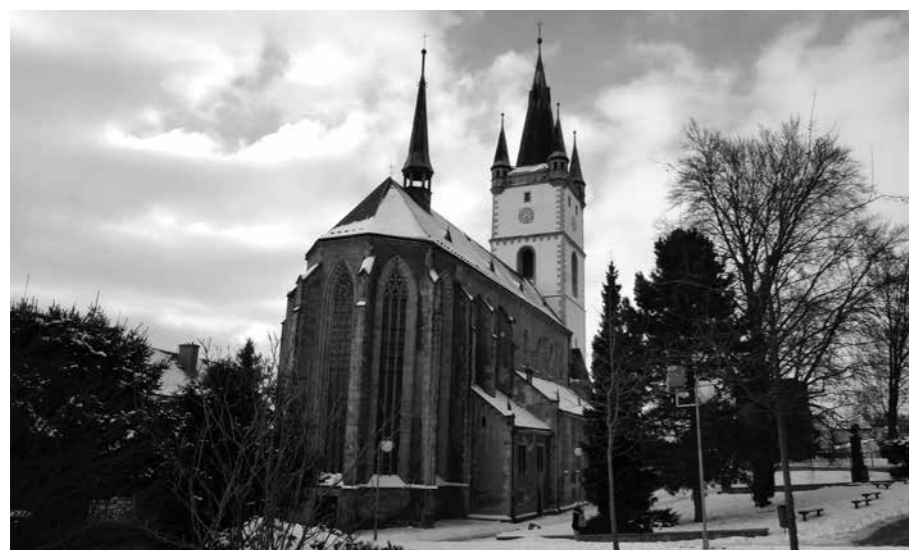
OCENĚNÍ V SOUTĚŽI PAMÁTKA PLZEŇSKÉHO KRAJE ZÍSKALA OBNOVA KOSTELA NANEBEVZETÍ PANNY MARIE V TACHOVĚ.