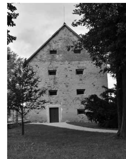
SÝPKA JE POSTUPNĚ OBNOVována. V ROCE 2017 V NÍ BYLO OTEVŘENO CYKLOMUZEUM.

V areálu bývalého klášterního pivovaru se nachází část lůžkového oddělení Domova sv. Josefa, ovšem v přízemí