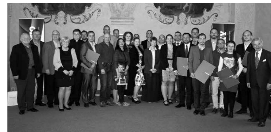
ZÁSTUPCI VEŘEJNÝCH SBÍREK OČENĚNÝCH V SOUTĚŽI MÁME VYBRÁNO 2019