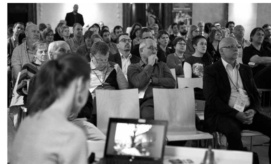
JEDNA Z PANELOVÝCH DISKUZÍ PŘEDSTAVILA MOŽNOSTI SPOJENÍ SOCIÁLNÍHO PODNIKÁNÍ S PÉČÍ O PAMÁTKU.

Podrobnější informace o podnikání v památkách přinášíme také ve sborníku konference MÁME VYBRÁNO, kde pravidelně zveřejňujeme nejen přednášky, ale také přepisy panelových diskuzí. Institut pro památky a kulturu projekt organizuje ve spolupráci s Ministerstvem kultury a Národním památkovým ústavem. ■