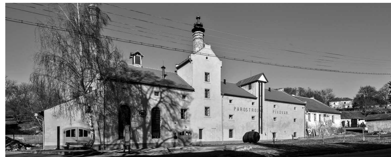
AREÁL PAROSTROJNÍHO PIVOVARU V LOBČI SE PODAŘILO PŘÍKLADNĚ OBNOVIT A NAVRÁTIT DO NĚJ ŽIVOT.

Poutní cesta Hájek se snaží postupně opravit jednotlivé kaple podél historické barokní cesty z Prahy do Hájku u Červeného Újezdu. V letech 2015–2017 se konala veřejná sbírka, která podpořila obnovu kaple č. XVIII na cestě mezi Litovicemi a Hájkem. Podařilo se v ní shromáždit více než 327 tisíc korun. Po úspěchu první sbírky se v září 2019 spolek rozhodl vyhlásit další sbírku, která by pomohla zachránit kaple č. XIX a XX stojící na samém konci poutní cesty. www.poutnicestahajek.cz