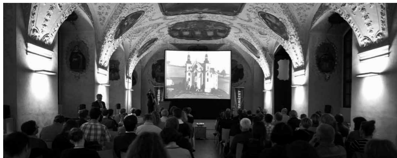
KONFERENCE MÁME VYBRÁNO SE KONALA V DOMINIKÁNSKÉM KLÁŠTEŘE V PRAZE. TEMATICKY SE ZAMĚŘILA NA PODNIKÁNÍ V PAMÁTKÁCH.