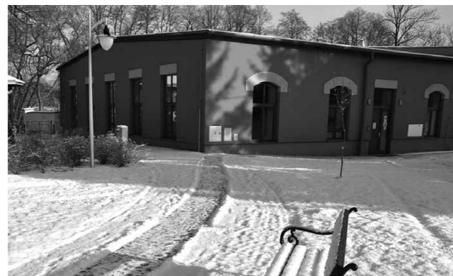
V ZREKONSTRUOVANÉ BUDOVĚ BÝVALÉ JUTY SE V SOUČASNOSTI NACHÁZÍ PRÁDELNA A MALÁ ŠICÍ DÍLNA.

V roce 2004 byla zřízena malá šicí dílna, která začala svůj provoz na chodbě Domova sv. Josefa. Nyní se také nachází v této budově, kde má vlastní místnost sloužící jako dílna, další prostor je pro sklad a v zadní části se nachází střížna. Je zde zaměstnáno 13 lidí se zdravotním znevýhodněním. Pracovní doba se pohybuje okolo šesti hodin. Zaměstnanci nastupují na šestou hodinu ránní a domů odcházejí po dvanácté hodině. Dílna primárně šije polohovací pomůcky pro zdravotníctví, ale v jejím sortimentu nalez-