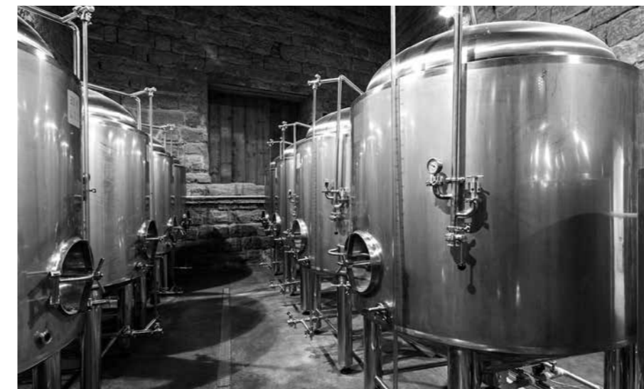
OBNOVENÝ PIVOVAR JE PŘÍSTUPNÝ PRO NÁVŠTĚVNÍKY A OD ROKU 2015 SE V NĚM OPĚT VAŘÍ PIVO.

Areál pivovaru v Lobči leží v CHKO Kokořínsko – Máchův kraj, jádro vesnice je památkovou zónou a samotný pivovar je zapsanou kulturní památkou. Od počátku proto byla nezbytná spolupráce jak památkářů, tak ochránců přírody. Ohlédnu-li se zpět, myslím, že se nám docela hezky podařilo nacházet při jednotlivých tématech společnou cestu a výsledek obnovy tomu také odpovídá. Časem ta spolupráce přerostla v partnerství.