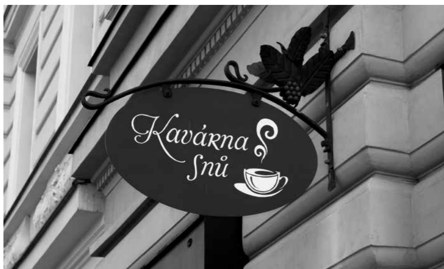
PŘÍKLAD TRADIČNÍ FORMY UPOUTÁVKY, KTERÁ JE V SOULADU S PAMÁTKOVOU HODNOTOU BUDOVY.