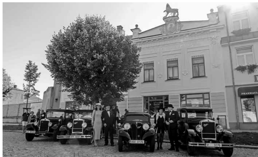
OSLAVOU 100. VÝROČÍ REPUBLIKY OŽILA REZIDENCE VELIŠ V ROCE 2018.