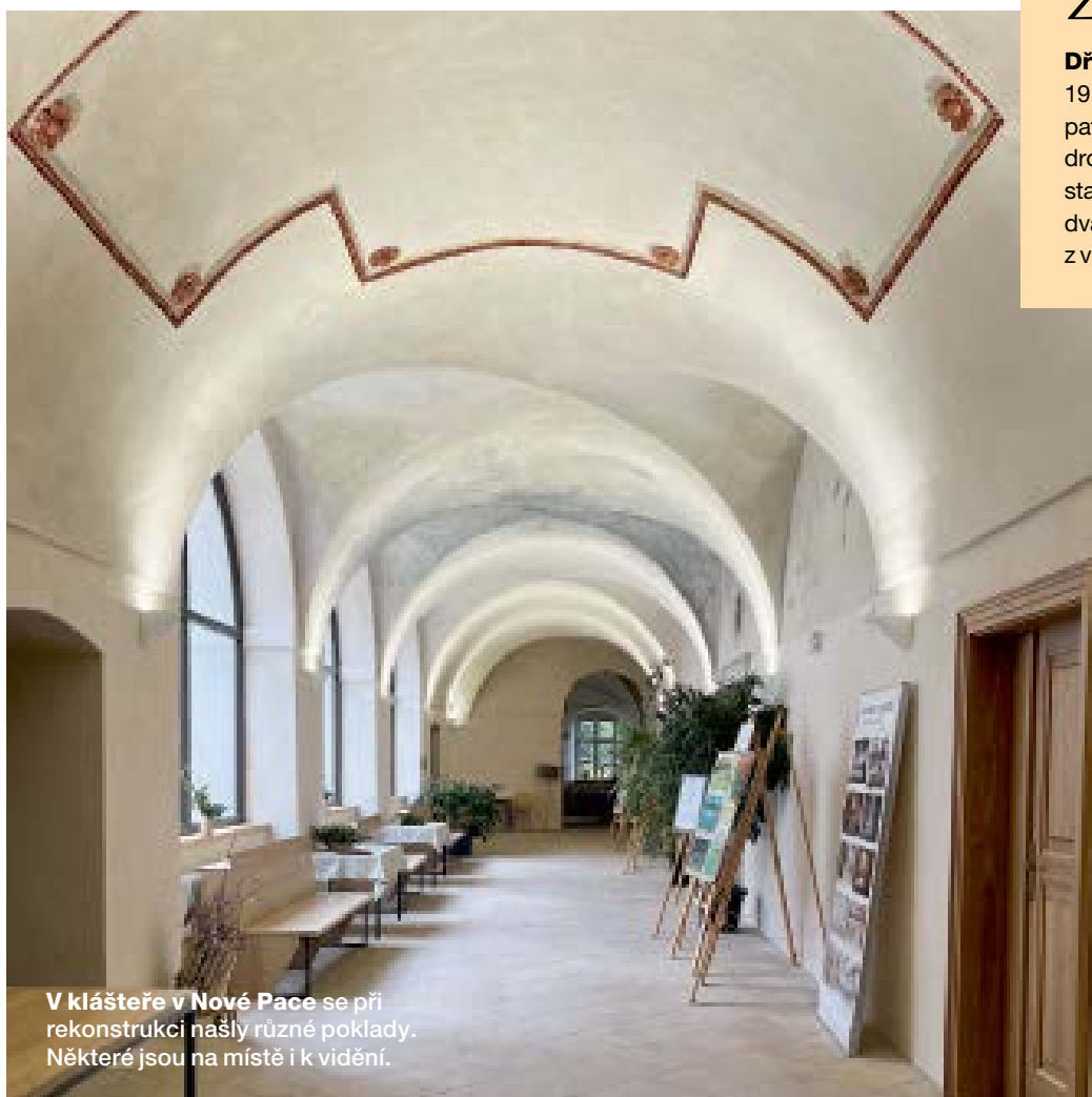
V klášteře v Nové Pace se při rekonstrukci našly různé poklady. Některé jsou na místě i k vidění.

Dřevěná zvonička z konce 19. století v obci Neprobylice také patří mezi zachráněné památky, leč drobné. Do krovu zatékalo, celkový stav byl špatný... Doslova za pět dvanáct se obci podařilo stavbu z vlastních zdrojů obnovit a zachránit.